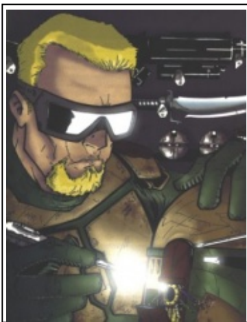
Ein Mandalorianer wartet seine Rüstung.

Die Rüstung ( beskar'gam , "Eisenhaut") ist sicher das, was man am ehesten mit den Mandalorianern verbindet - sie ist charakteristisch für das ganze Volk und wird von Männern wie Frauen gleichermaßen getragen. Die Rüstung spielt in der mandalorianischen Kultur eine zentrale Rolle, was man daran erkennen kann, dass das Tragen einer solchen die "Erste Handlung" der Resol'Nare darstellt.