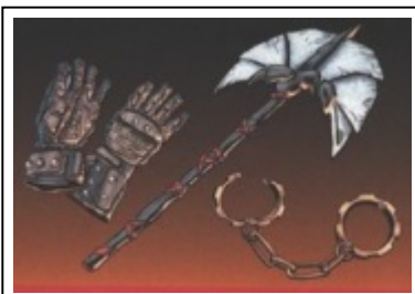
Traditionelle Waffen: die "Crushgaunts" und eine "Mythosaurier-Axt".

Die Mandalorianer sind religiös sehr aufgeklärt eingestellt. Während ihre Vorfahren noch einer Art polytheistischen Naturreligion anhängen, werden die alten Schöpfungsmythen wie das Akaanati'kar'oya ("Der Krieg des Lebens und Sterbens") heute eher metaphorisch gesehen. Als nomadische Kultur halten die Mandalorianer ihre Geschichten und Mythen insbesondere durch das gesprochene Wort und Erzählungen lebendig, wie die Geschichte der Mythosaurier oder die Legende der gefallenen Könige von Mandalore, aber selbst diese Geschichten werden eher pragmatisch gesehen.