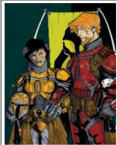
Eine mandalorianische Hochzeit.

Kinder gelten mit 13 Jahren als erwachsen; mit 16 heiraten sie in der Regel. Hierbei halten es die Mandalorianer jedoch gewohnt pragmatisch und unkompliziert; die Eheschließung ist kein aufwändiges und langatmiges Ritual, sondern ein einfacher Schwur, der auch wieder aufgelöst werden kann (auch wenn eine Heirat für das ganze Leben gelten soll).